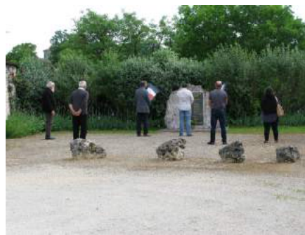
Monument aux Morts Saux