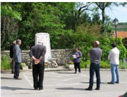
Monument aux Morts Le Boulvé