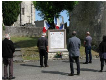
Monument aux Morts Fargues

Les cérémonies annuelles seront organisées tous les ans de la même manière avec un dépôt de gerbes à chaque monument aux morts pour commencer, puis le rassemblement à 11h30 suivi du verre de l'amitié :