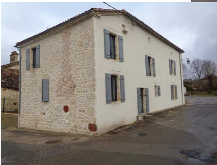
Maison Hugou Le Boulvé (2 appartements)