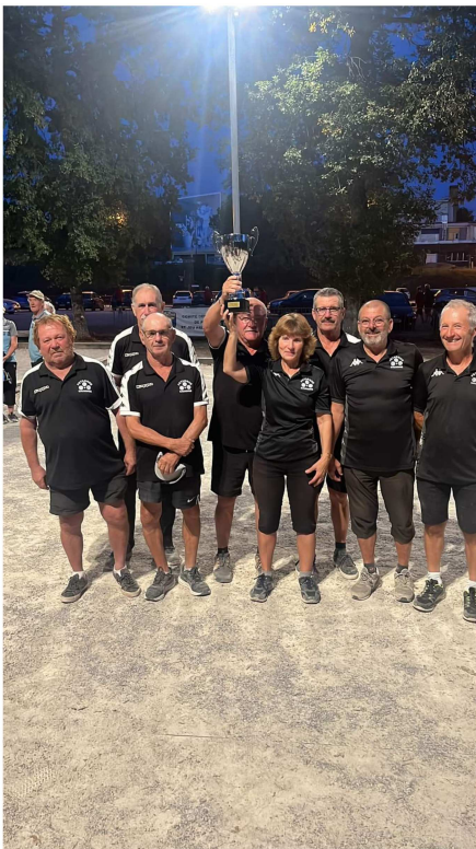
Pétanque Sauxoise : Vétérans champions du Lot