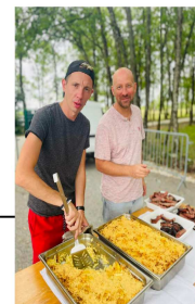
Les présidents au travail, Fête des associations