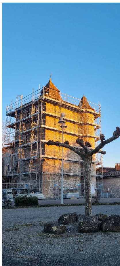
Mise en place d'un échafaudage pour les travaux de réfection de l'église de Saux sur 2026