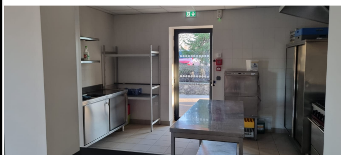
Salle des Fêtes de Saux rénovée